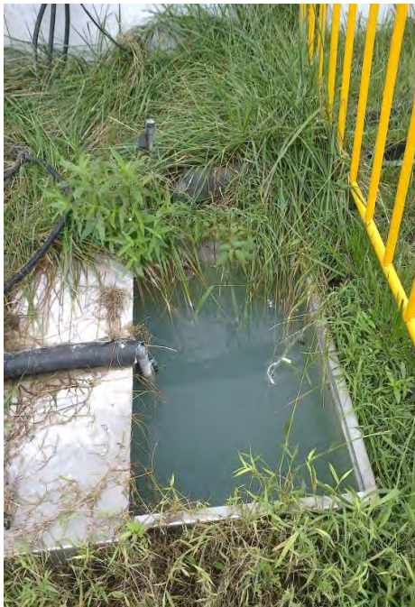
用过的掺有切削液的废水直接暴露在外

工人在加工外壳时候直接用手接触这些切削液，工厂却没有按时给工人发放手套。触到切削液一段时间，工人的皮肤会瘙痒、红肿、脱皮。中国劳工观察的调查员自己也曾出现过这样的症状。此外也有工人反映抱怨切削液会飞溅到眼睛里，刺痛双眼。根据美国职业安全与健康局（OSHA）的信息和规定，“金属切削液的皮肤接触和呼吸，已经被牵连于刺激皮肤、肺、眼睛鼻子、喉咙等健康问题。金属切削液的接触，与皮肤炎、痤疮、哮喘、过敏性肺炎、上呼吸道刺激以及不同癌症等症状相联系。健康问题的严重性取决于几个因素，包括切削液的性质、污染的程度与种类以及接触的程度与种类。”