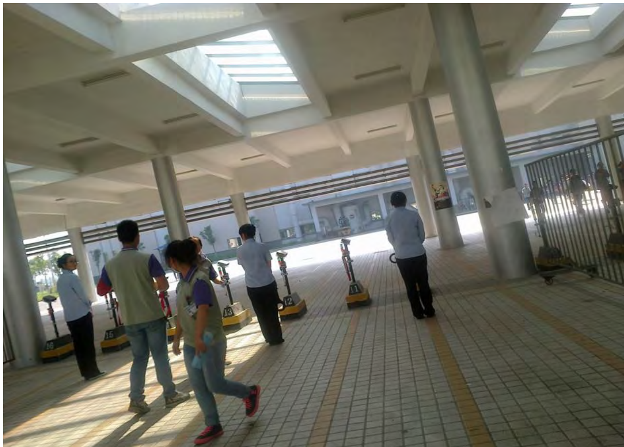
工人核验工牌及录入指纹的地方