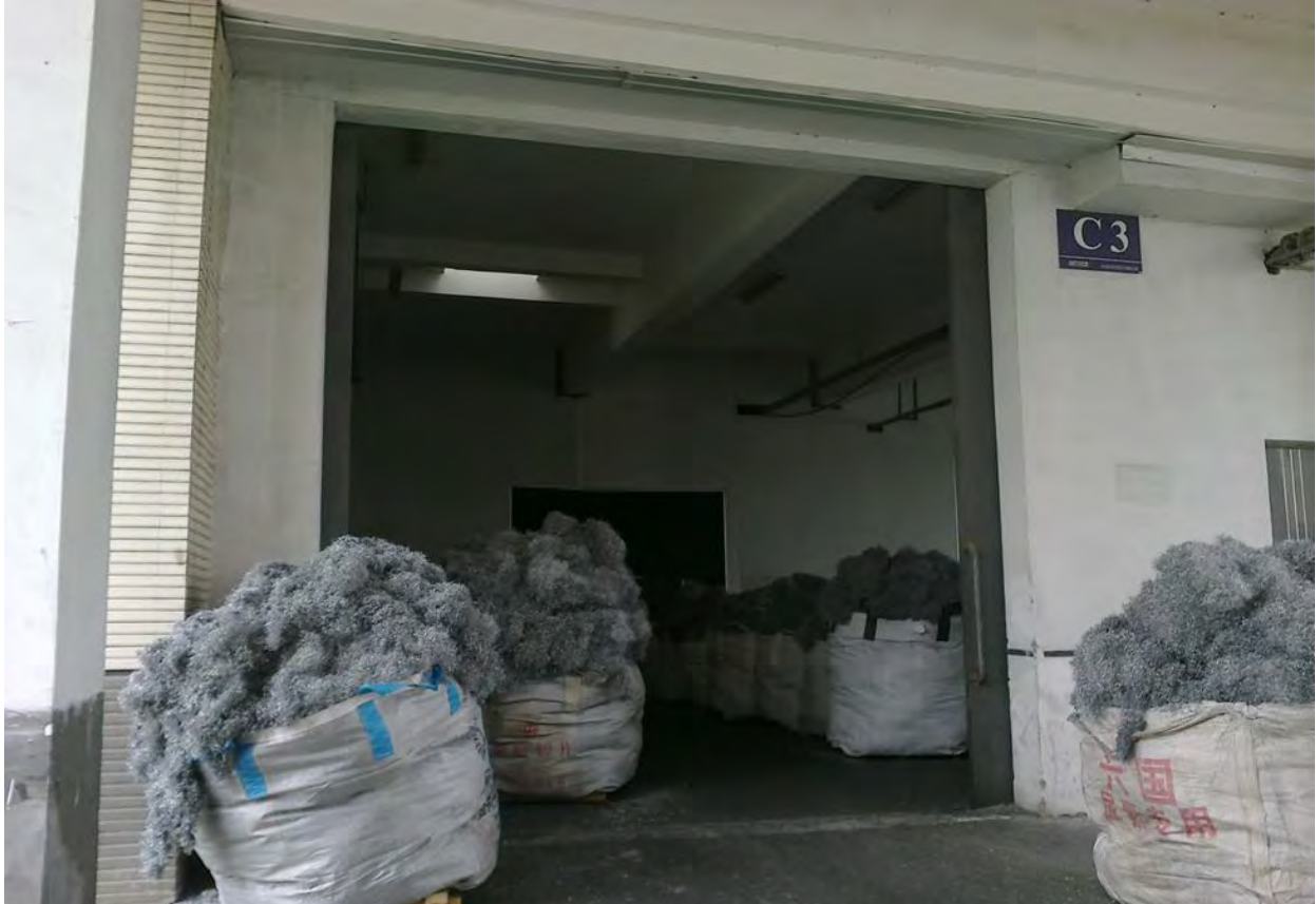
生产苹果产品外壳产生的金属废屑

工厂会给工人在入职前和工作期间体检，而离职时则没有体检，这导致工人在离职前不知道自己是否在工作期间患上职业疾病。工人无法得到体检结果的复本，只有在 20 日之后通过政府网站查询自己的体检结果。工人入职没有职业安全培训，但被强制要求签字已接受安全培训。当中国劳工观察的调研员问工人是否知道在场内有职业安全委员会时，工人们表示不知道。组长们证实工人们已经通过了安全培训并且在安全培训表格上签字，但是实际上工人们并没有接受任何此类型的培训。