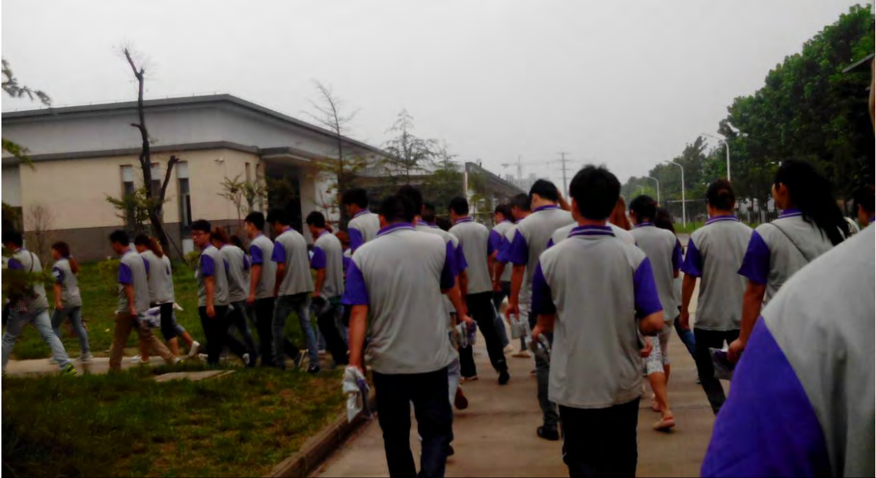
新入职的工人被带入车间