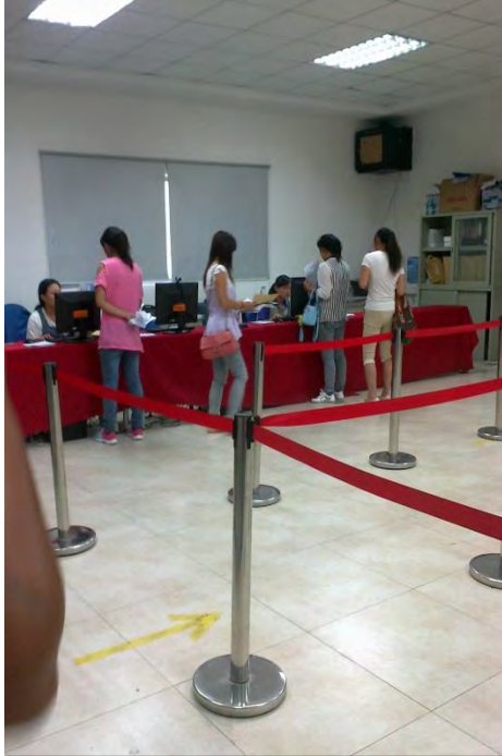
在招聘办公室的新职工

在可成核验身份证有效并核对照片之后，开始检查纹身。检查时要求工人必须把两只手和胳膊全部展示出来。有的男工人需要脱掉上衣证明他们没有纹身。检查肢体动作时工作人员要求工人跑步、摆动四肢以确保肢体是健康的。被正式录用前，工人们会得到一张雇佣通知，上面注明工人身份证号码、姓名、注册时间和注册表格。表格上有录取结果和可成人事部的公章。