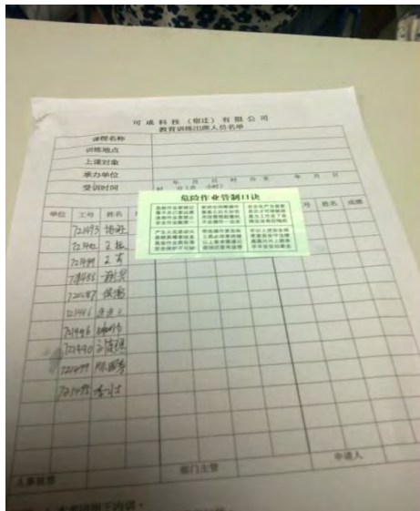
工人们在空白的参加培训表格上签字

录取之后的第二天上午，工人们需自行缴纳 50 元参加体检。体检主要包括采血、心电图、内科、外科、五官科、尿常规和 X 光透视。工人 20 天之后可以在政府网站上查到自己的体检结果，工厂不会发给工人体检结果的副本。体检结束后工人们还需要填写一系列表格、交纳 6 张身份证复印件和 4 张一寸照片。这些表格中包括一份人事部提供的档案记录文件、劳动合同、苏州宿迁工业园区劳动合同备案登记表、可成集团特殊岗位职业卫生告知相关事项、普通员工保密协议书、承诺书和员工住宿申请单。表格填写完毕后发放工衣、工作规则手册、工作牌和工作服。