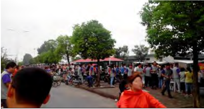
早晨聚集在可成（宿迁）工厂外的工人们

职业安全培训及工作场所有大量灰尘，特别是那些操作潜在有毒化学物质的工人却没有为他们提供保护措施的情况。