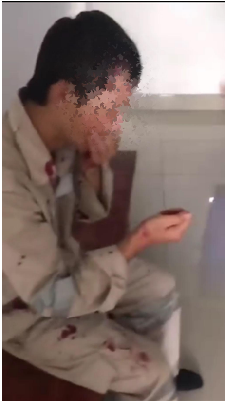
在公司被殴打至流血的工人