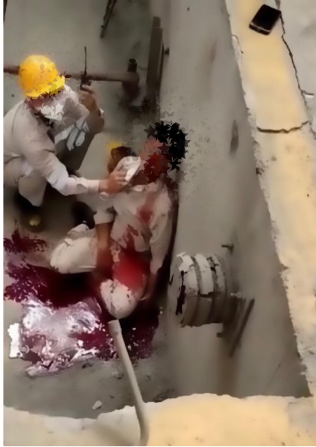
在作业中被钢包车挤死的工人