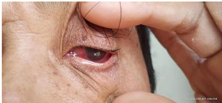
工人展示自己受工伤后因没有得到任何治疗而失明的眼睛