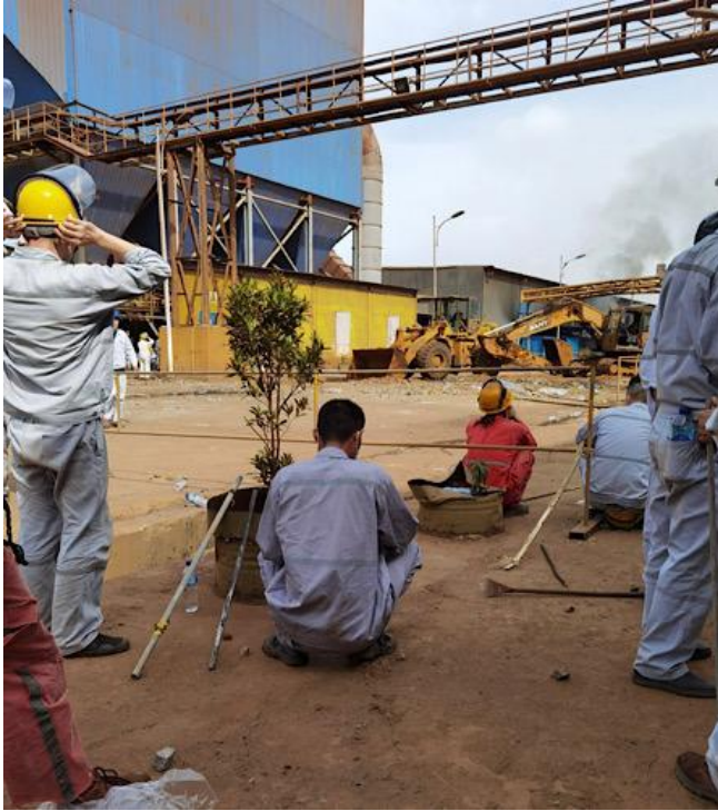
被强迫看守工厂的中国工人，身边放着发给他们的钢管，用来攻击抗议的印尼工人

他工作的厂区有一名中国工人，在2020年7月27日干活时左眼受伤。工人去找分包公司现场负责人要求看医生，结果不但没有得到治疗，负责人还叫来驻厂保安把这位工人拘禁了三个多小时，后来在工人强烈要求下送到医院，但是当地医疗条件差，无法处理眼外伤。第二天，这名工人请求分包公司现场负责人安排回国治疗，但分包商表示，总包公司不允许工人回国，并告诉他，“眼睛瞎了就瞎了”。