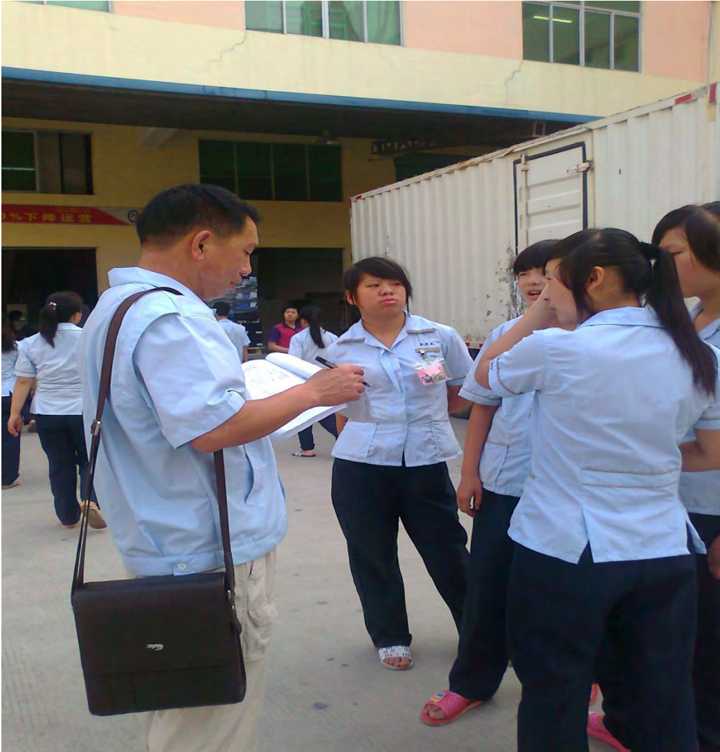
培训的老师向学生工教一些工厂实习的事项