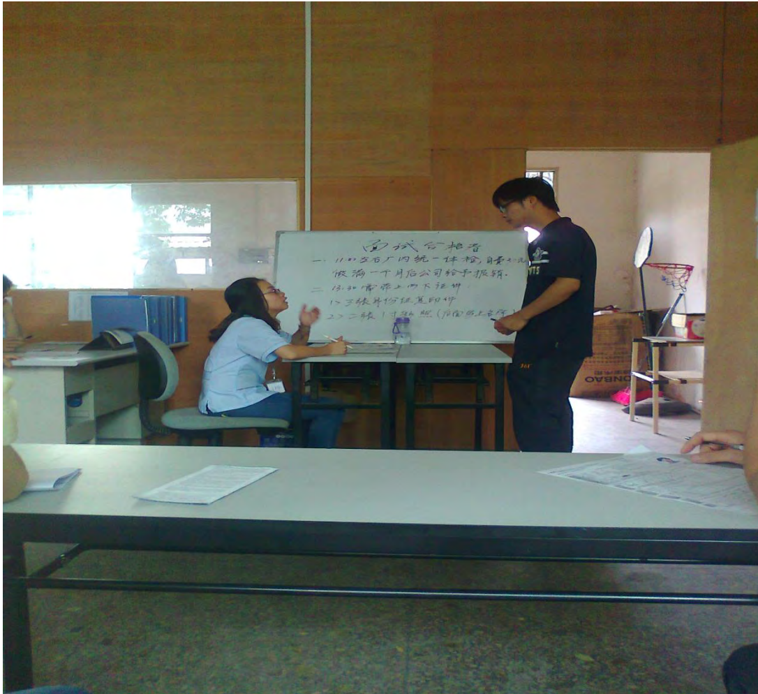
入职程序中的面试阶段

及残障的都采取一律不录取的态度。由这些不成文的公司内部限制中可以看到该公司对年龄、性别以及个性方面的歧视。