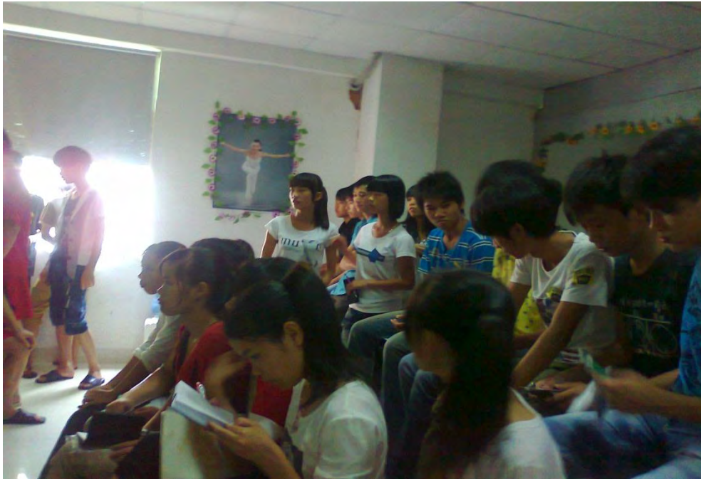
职工技校的学生工

除了对童工的虐待问题，“海格国利”对学生工的管理和待遇也存在较大的缺陷。根据我们的调查显示，长期驻“海格国利”公司的学校有：“湖南远东职业学校”、“重庆涪陵信息技术学校”、“贵州铜仁沿河中等职业学校”、“重庆綦江职高技术学校”、“广东湛江城月电子学校”、“广东湛江雷州第六中学”、“广东湛江太平三中”、“广东化州市杨梅中学”等等。