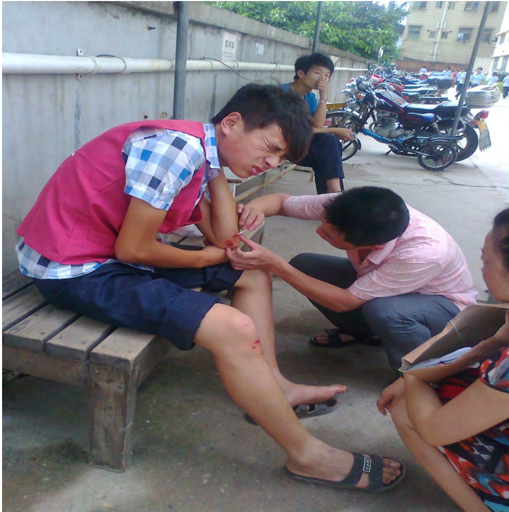
员工在工作中受到工伤

公司员工既不清楚有“环境健康安全委员会”，也不清楚环境安全方面的培训，而且由于培训后是不需要考试的，因此员工在入职培训时不会注意听讲职业安全的相关知识因而缺乏这种自我保护意识。公司也没有安排在职、离职员工做职业体检。